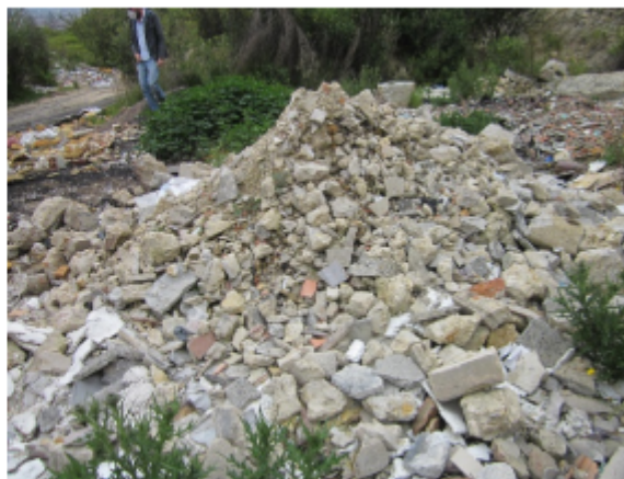
Fotografías Nos. 7 y 8. Cantera El Volador Se observan los depósitos de residuos de construcción y demolición - RCD