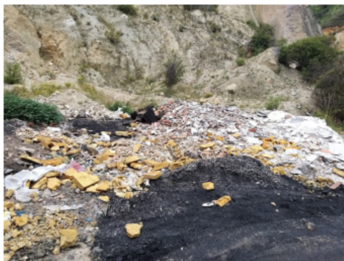
Fotografía No. 9. Cantera El Volador. Se aprecia el área de quema presuntamente de residuos